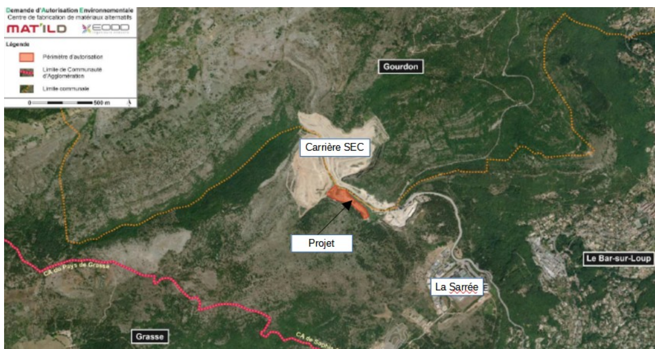
Figure 1: Localisation du site

Le projet, porté par la société MAT'ILD (Matériaux Innovation Logistique Déchets), a pour objet la création d'un centre de fabrication de matériaux alternatifs sur la commune de Le-Bar-sur-Loup, dans le département des Alpes-Maritimes (06). La commune appartient à la communauté d'agglomération de Sophia Antipolis (CASA) et est incluse dans le périmètre du parc naturel régional des Préalpes d'Azur.